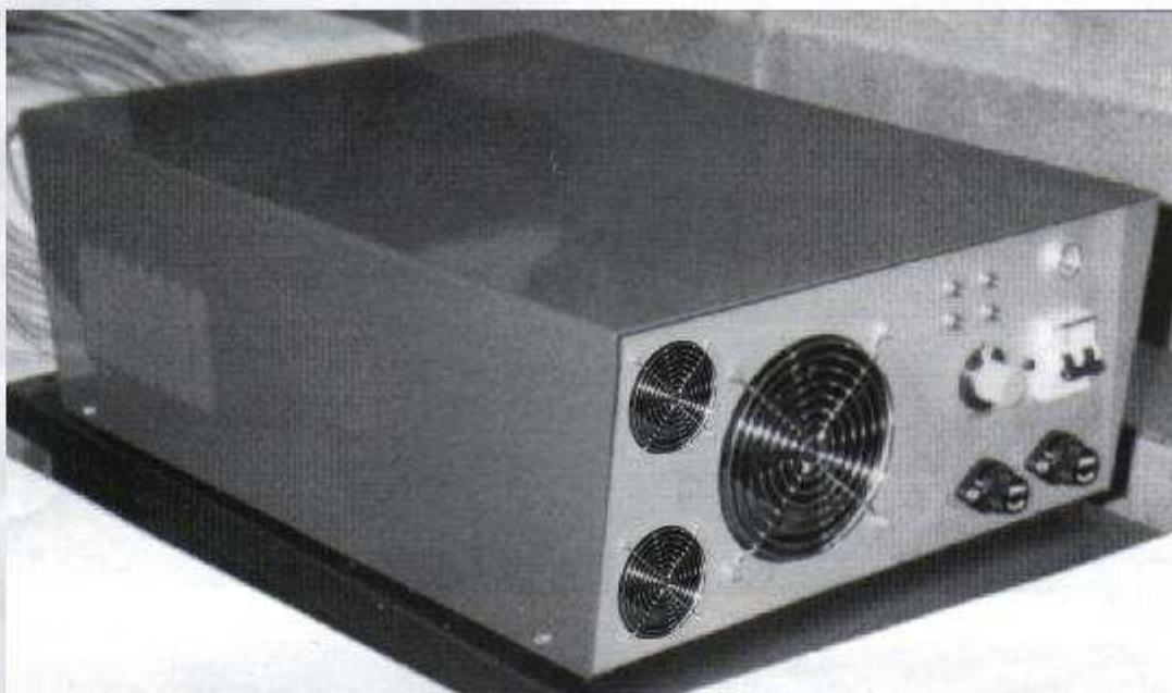
FIG. 2 - NUOVO GENERATORE TRIFASE A MICROPROCESSORE TIPO "ULTRASUONI PIEZO 20.000" CON UNA POTENZA EFFICACE DI 20Kw A FREQUENZE DA 18.000 A 45.000 Hz (18/45 KHz)

"In effetti - spiega Puddu - ogni Fonderia esprime casi analoghi, quali lo stampaggio e la fusione di particolari di precisione per l'automobile, i casalinghi, la meccanica, ... ma ogni singola officina denota molte diversità nell'utilizzo dei